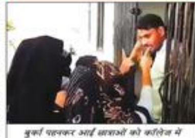
प्रवेश करने से रोकता अधिकारी।

क्टेलेज के स्वापक निर्देशक स्ट्रीया तार्ज ने बाताचा कि विश्वास दूका दिनों से राज्यातन जावार्ष बुक्ती पहरकर करियेत का रही थी। करियत प्राच्यान पुटा सारकार्ष को चुनियार्थि में कार्य के रित्य बोला का राज का शासाओं में करियों कार्यका को बाता को राज्यात्म कार्यक्रम हिलाब प्राचकर करिया कराय जारी रखा। जिसके बार असा सम्बद्धा हों करते दिसने हुए साओं को रोकन पहा ; इस्ते कर करता कुछ अवन्यतिक तत्त्वों के साथ करेतेन पहुंच गई और नगकर गरिकारों करने तत्त्वीं :